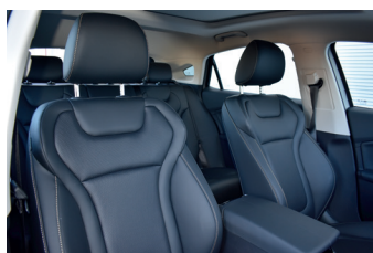
Negro con costura camello