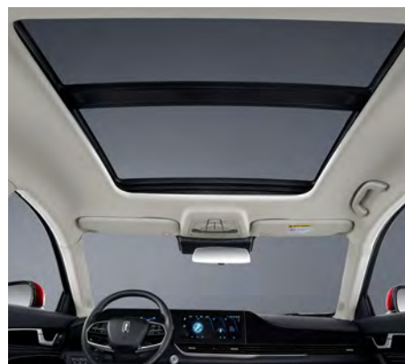
Sunroof panorámico eléctrico.