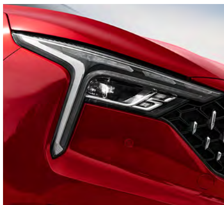
Faros LED con función de encendido automático.