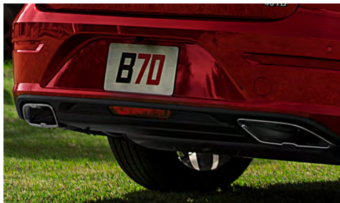
Escape cromado de doble salida cuadrada.