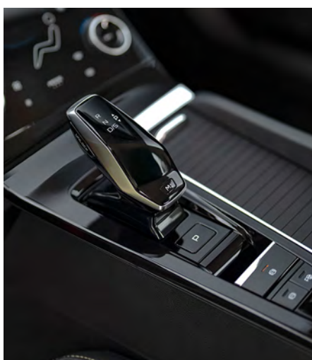
Transmisión 6 AT.