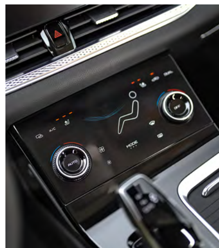
Aire acondicionado climatizado bizona.