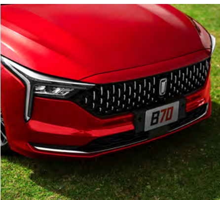
Parrilla con forma de gota.