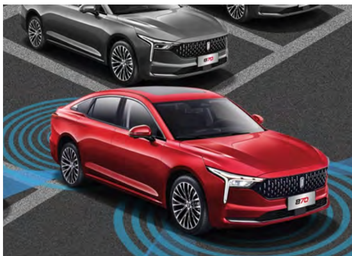
Advertencia de colisión frontal.