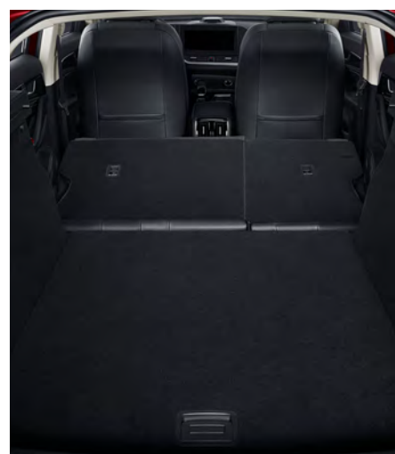
Asiento trasero abatible 40/60.