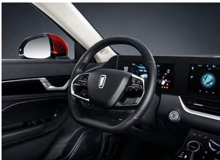
Asistente de cambio de carril (LCDA).