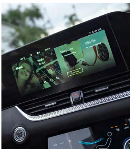
Pantalla touch central a color de 12.3".