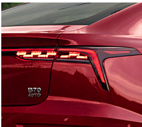
Faros traseros rítmicos LED.