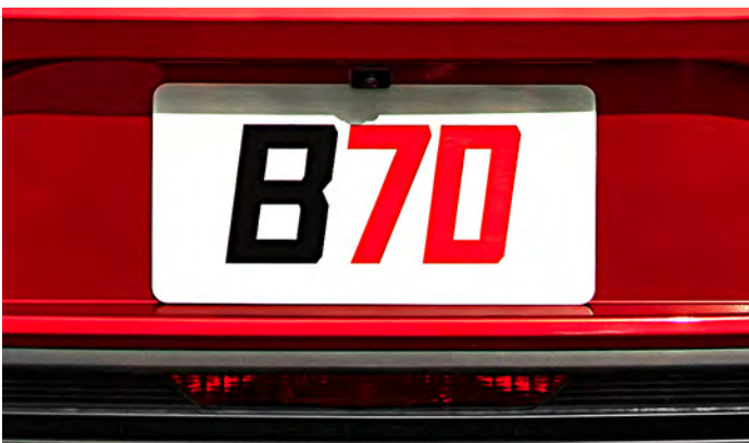
Cámara trasera con línea de guía para aparcamiento.