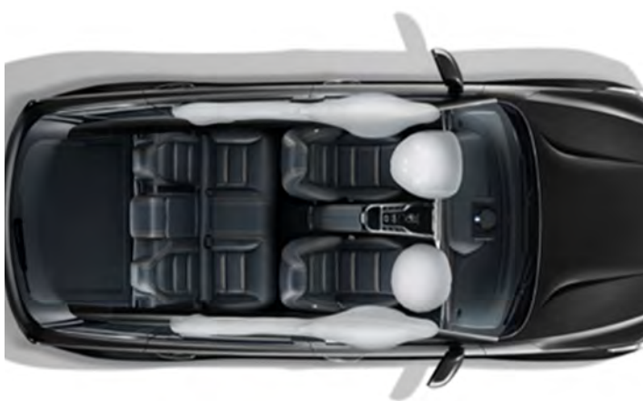
Bolsas de aire para conductor, pasajero y laterales tipo cortina.