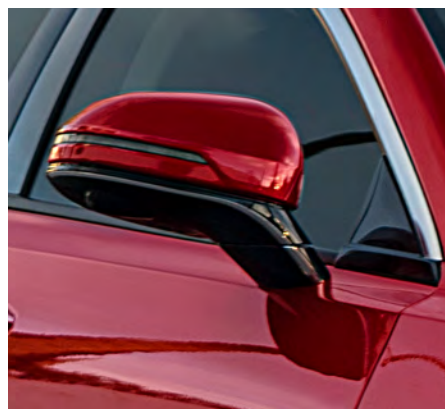
Espejos laterales con ajuste eléctrico y calentados.