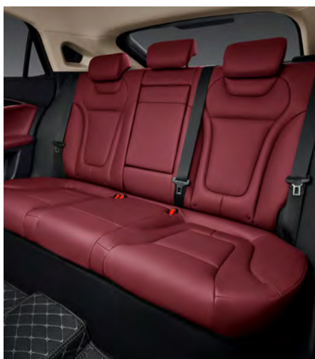
Asientos con piel vegana.