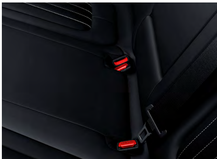
Cinturón de seguridad trasero.