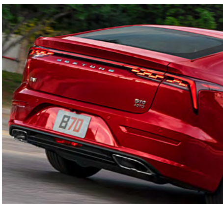
Cajuela de gran apertura.

B70 lo tiene todo, en cuanto diseño, estilo y usabilidad, será tu aliado perfecto en ciudad o carretera, este modelo está especialmente diseñado para llevar tus sentidos al límite.